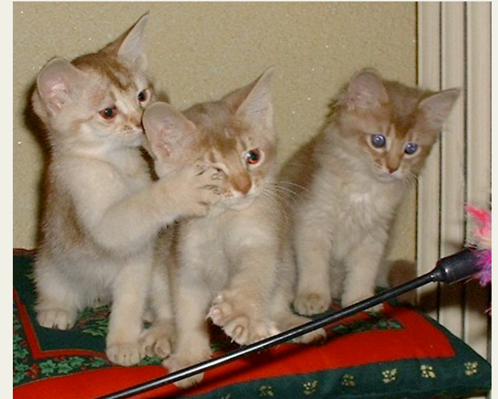
Variant à gauche, le somali est à droite