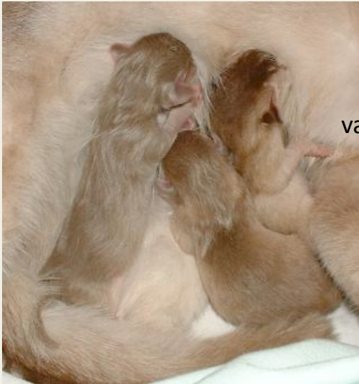
Somalis à gauche

Poils longs ou variants ? Portée de 1 som <- et -> 2 aby «var»